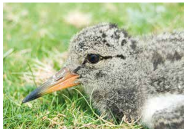
Abb. 21-22: Kopfansichten zweier 14-tägiger Küken. Links ein außergewöhnlich dunkles, rechts ein gewöhnlich gefärbtes Küken. – Views of heads of two fourteen days old chicks. Left: an abnormally dark coloured, right: an averagely coloured chick.

Zwischen gleichaltrigen Vögeln, mitunter sogar zwischen Geschwistern, herrscht eine gewisse Variation im Fortschritt des Gefiederwachstums, was vor allem im Gesicht und auf den Flügeldecken auffällig sein kann (Abb. 23).