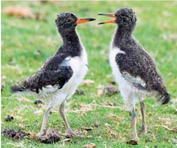
Abb. 23: Unterschiedlich weit fortgeschrittenes Gefiederwachstum bei zwei 19-tägigen Geschwistern. – Differently progressed growth of plumage in two 19 days old chicks.