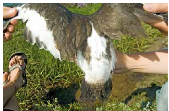
Abb. 18: Rückenansicht eines 32-tägigen Kükens. – Views of the back of a thirty-two days old chick.

Ab dem 40. Tag sind kaum mehr Dunenreste zu erkennen. Kopf, Hals, Nacken und Oberseite sind dunkelbraun befiedert. Auf dem Rücken und der Flügeloberseite sind die Federn hellspitzig. Am Hals setzt sich nur noch ein dünner, hellerer Dunenkragen ab (Abb. 24), der im späteren Jugendkleid ebenfalls verloren geht und einen helleren Kehlfleck sichtbar werden lässt. Durch die Mauser in das erste Winterkleid wird ein breiter weißer zu einem „halsbandartig ausgeweitetem weißen