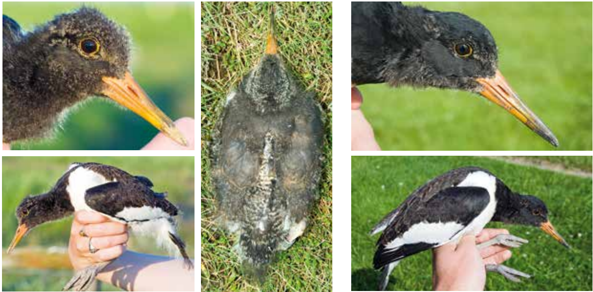
Abb. 13-15: Kopf-, Seiten- und Rückenansicht eines 25-tägigen Kükens. Der graue Fleck am Rücken rechts unten ist ein zur Radiotelemetrie auf die Dunen geklebter Sender. – Views of head, side and back of a twenty-five days old chick with radio transmitter glued on the dunes.