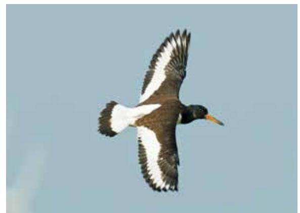
Abb. 24-25: Flügler 42 Tage alter Jungvogel. – Forty-two days old fledgeling.