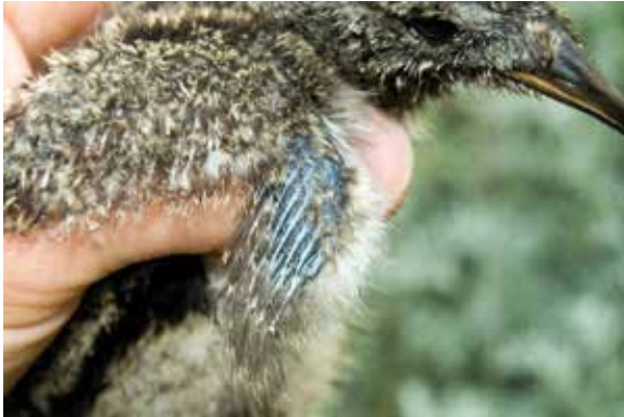
Abb. 19: Oberflügel eines elftägigen Kükens. – Upperwing of an eleven days old chick.