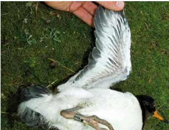
Abb. 20: Unterflügel eines 29-tägigen Kükens. – Underwing of a twenty-nine days old chick.

Kehlfleck“ ausgebildet (Glutz von Blotzheim et al. 1999). Die Unterseite sowie Teile von Rücken, Schwanz und Großgefieder sind weiß.