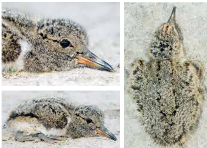
Abb. 4-6: Kopf-, Seiten- und Rückenansicht eines siebentägigen Kükens. – Views of head, side and back of a seven days old chick.

Schnabel und Lidring: Der Schnabel ist schon ab dem zweiten oder dritten Tag großteils dunkel, mit von der Basis ausgehendem vari-