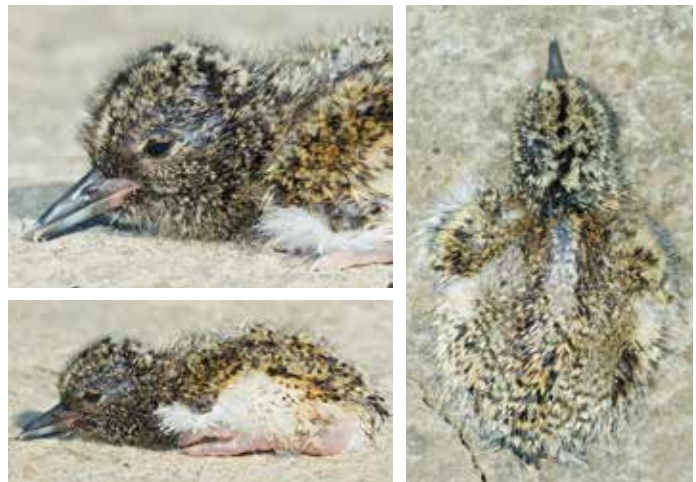
Abb. 1-3: Kopf-, Seiten- und Rückenansicht eines eintägigen Kükens. – Views of head, side and back of a one day old chick.

In den ersten Stunden nach dem Schlüpfen liegen die Küken nahezu regungslos in der Nestmulde. Während dieser Zeit trocknet das Dunenkleid je nach Wetter und Lufttemperatur unterschiedlich schnell. Zuerst geschlüpfte Küken verlassen mit trockenem Gefieder teilweise schon eigenständig das Nest und warten nicht immer auf das Schlüpfen der Geschwister. Der Aktions-