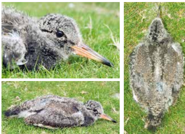
Abb. 10-12: Kopf-, Seiten- und Rückenansicht eines 19-tägigen Kükens. – Views of head, side and back of a nineteen days old chick.

Dementsprechend verdunkeln sich zuerst die Körperpartien, in denen als erstes die Federn des Jugendkleides nachschieben.